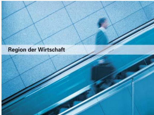
Region der Wirtschaft