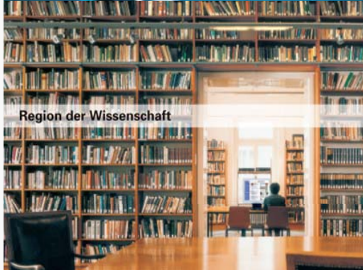
Region der Wissenschaft