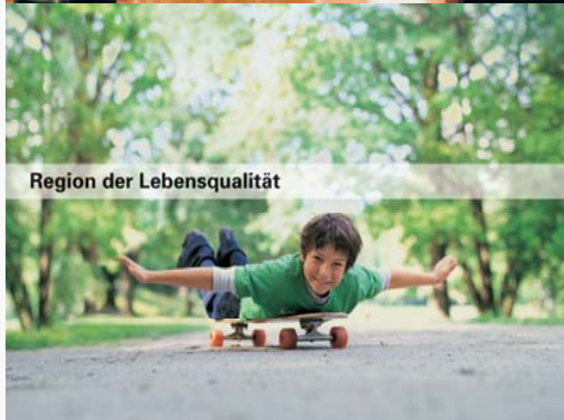
Region der Lebensqualität